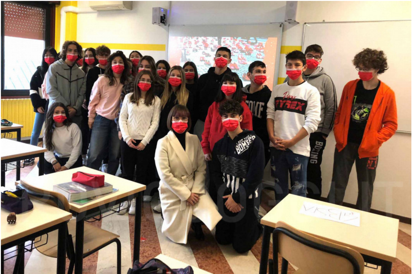
Articolo di Domenica 28 Novembre 2021